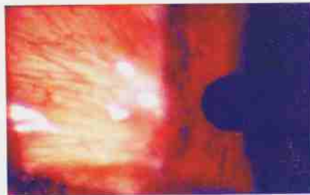
आकृति : 2

हळू हळू या नविन रक्तवाहिन्यांची संख्या वाढत जाते आणि हे मांस मांसल होत जाते (आकृति: 2) , जर या ठिकाणीच त्याची वाढ थांबविली नाही तर बाहुलीच्या दिशेने मांस वाढत जाते व त्याची वाढ होत असताना बुब्बुळाच्या आकारात बदल होऊन रुग्णाची नजर कमी होत जाते.