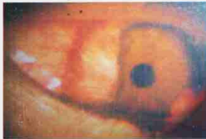
आकृति : 4

हे लेझर उपचार केल्या नंतर रुग्णास गरज असल्यास त्याच दिवशी कामा वर हजर होता येते. दवाखान्यात राहण्याची गरज नसते. आणि हे उपचार डोळ्यात संवेदना बधीर करण्याचे थेंब घालून केली जाते कोणत्याही प्रकारचे इंजेक्शन दिले जात नाही. आकृति : 4.