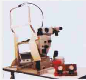
आकृति : 5

आम्ही अशा उपचारा साठी कार्ल-झाईस, जर्मनी, या कंपनीचे मशिन वापरतो आकृति : 5.